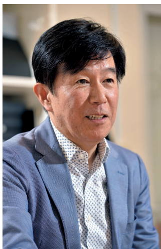
↑プライベートでは、バイオリンを華麗に弾きこなし奥様のピアノとともにコンサートも開催する達人。レースへの情熱をそのままホイール作りに注ぎ込み、数々の名作ホイールを生み出し続けている

そのときサーキットには、ADV ANカラーでフルカラーリングしたグランチャンマシンが走っていた。「当時サーキットで勢力を誇っていたのはプリヂェストンとダンロップ。